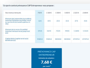
Prévoyance CAP Entrepreneur